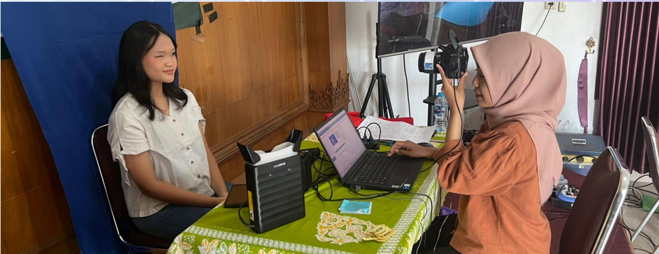
Petugas Pelayanan Perekaman Kartu Tanda Penduduk Elektronik (KTP-El)