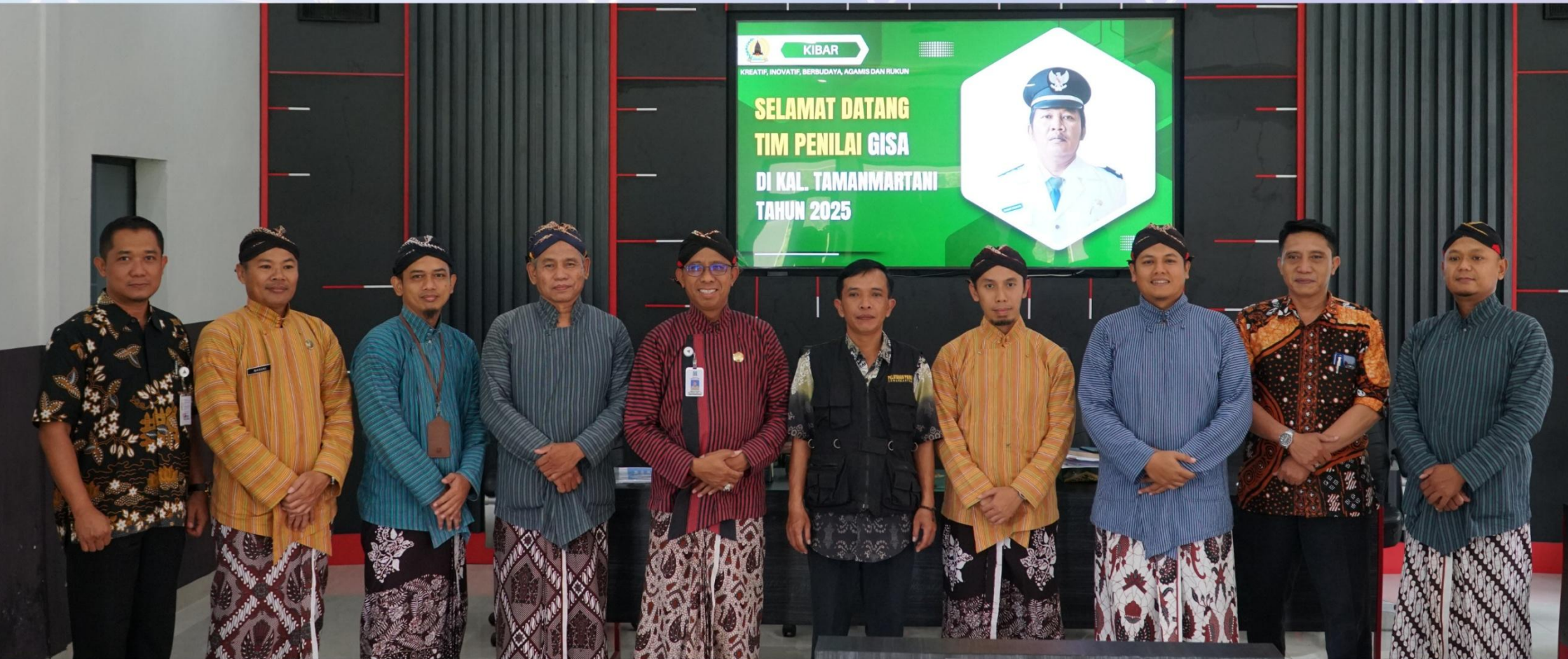
Uji Petik Evaluasi GISA Tahun 2025 di Kalurahan Tamanmartani, Kalasan