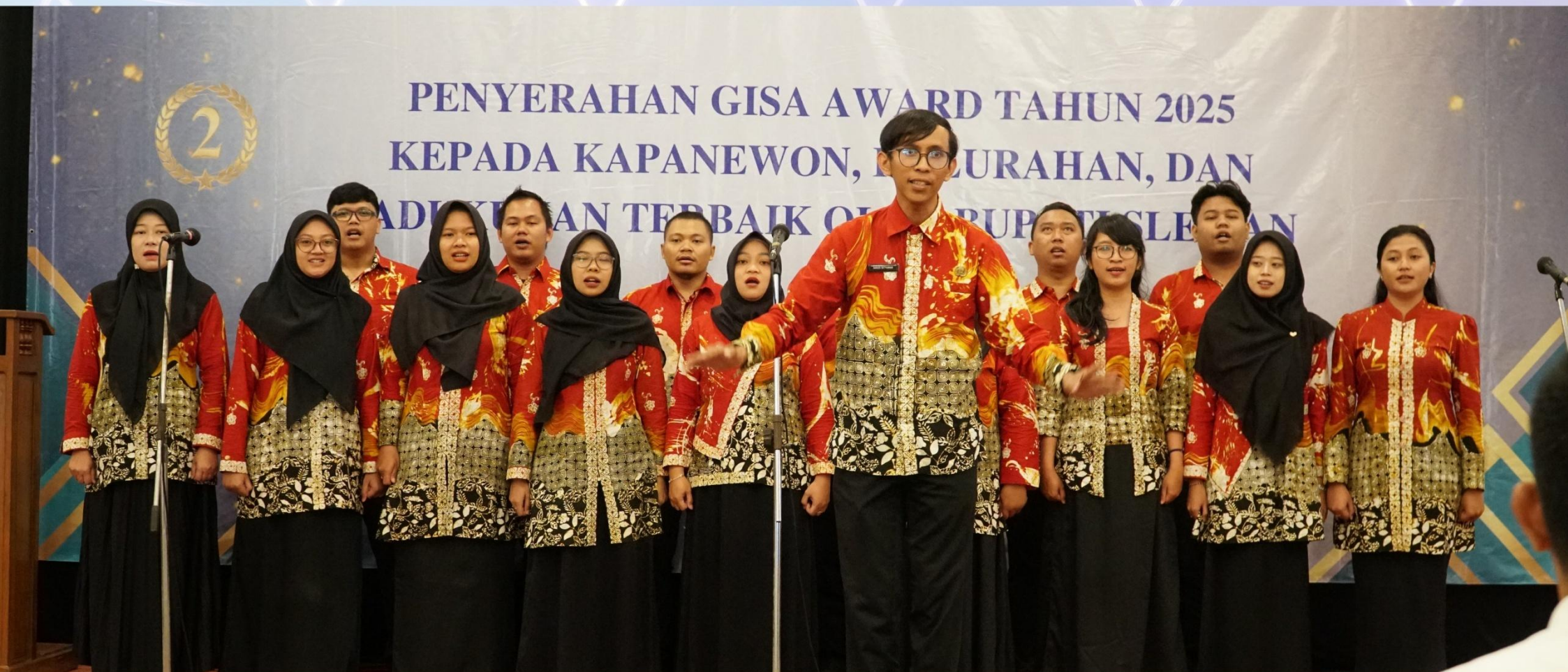
Penampilan Dukcapil Choir pada Penyerahan GISA Award Tahun 2025