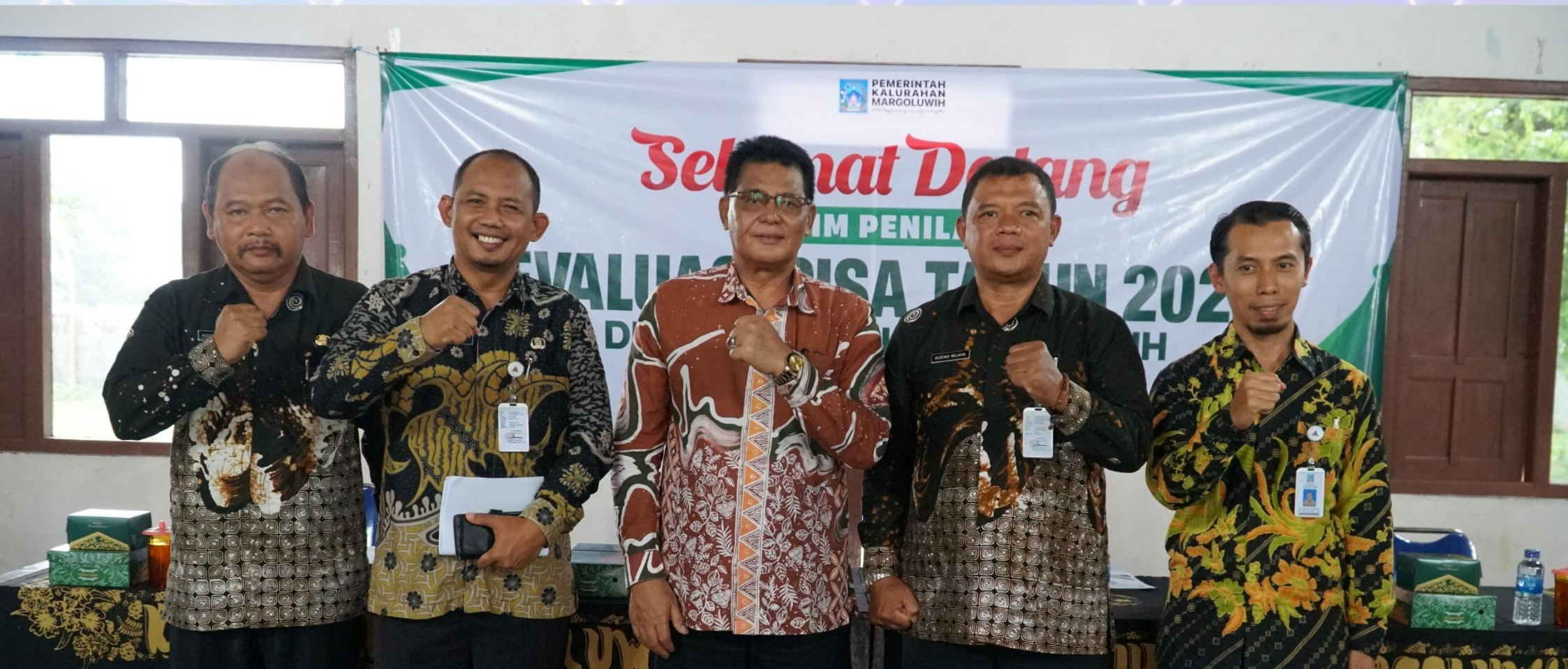
Uji Petik Evaluasi GISA Tahun 2025 di Kalurahan Margoluwih, Seyegan