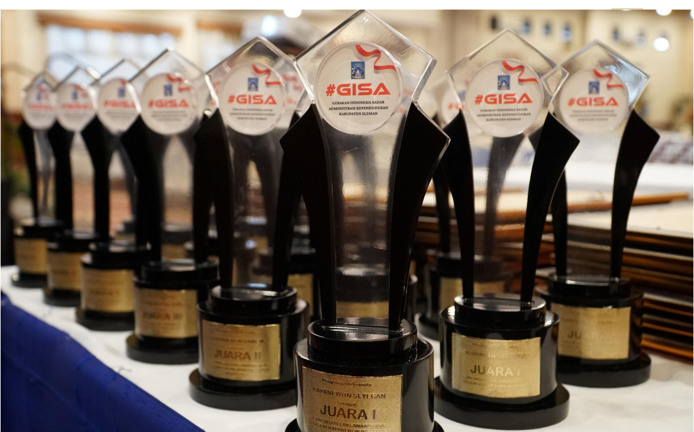
Piala GISA Award Tahun 2025