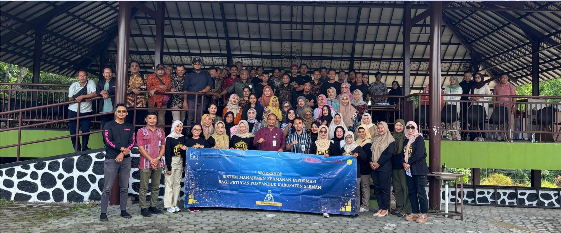
Workshop Sistem Manajemen Keamanan Informasi bagi Petugas Pos Pelayanan Dokumen Kependudukan Kabupaten Sleman