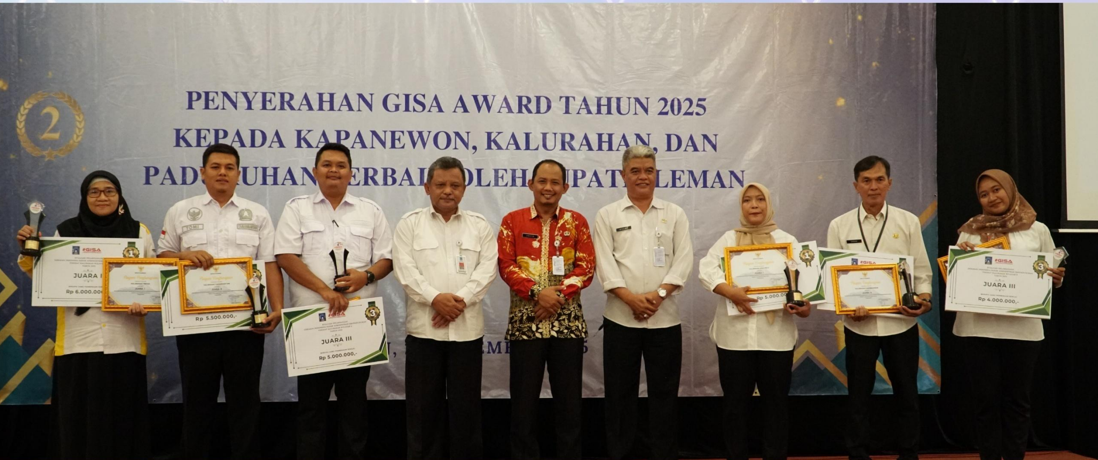
Penyerahan GISA Award Tahun 2025 Kepada Kapanewon, Kalurahan, dan Padukuhan Terbaik