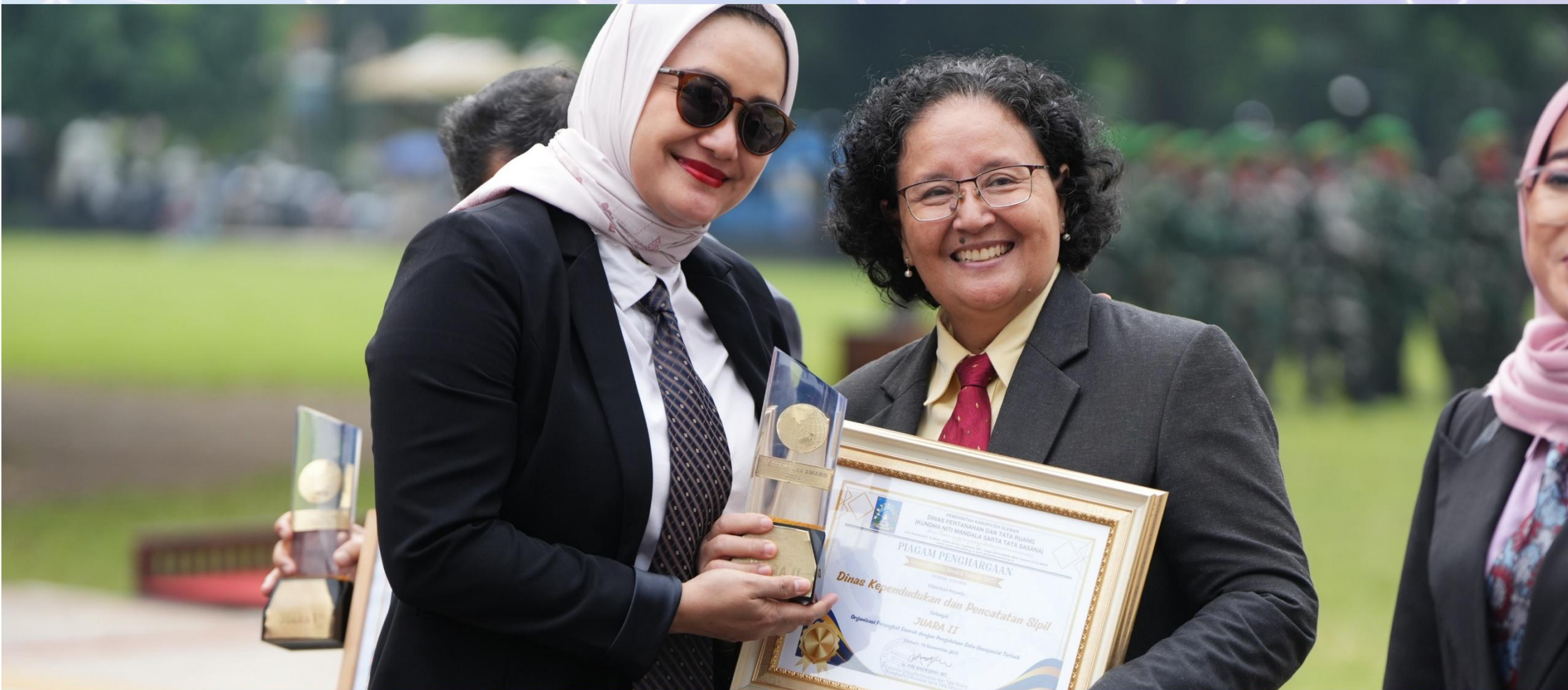
Penyerahan Piala dan Piagam Penghargaan Geosembada Award Tahun 2025 sebagai Juara II OPD dengan Pengelolaan Data Geospasial Terbaik